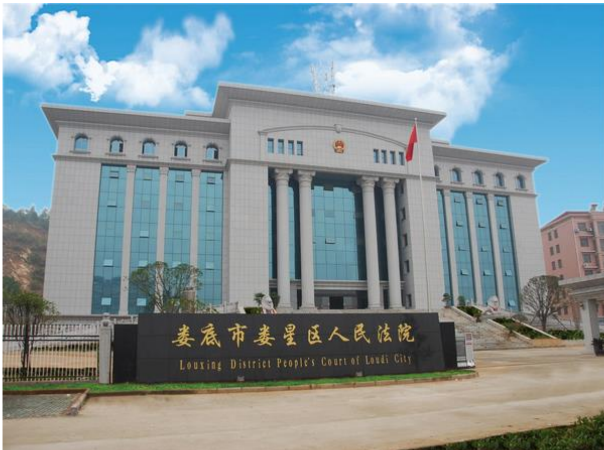
娄底市娄星区人民法院

娄底市娄星区人民法院成立于 1979 年 6 月，下设多个司法办公室及法庭，年均受理和办结案件 4000 余件，为全区经济社会的快速健康发展营造了良好的法治环境。